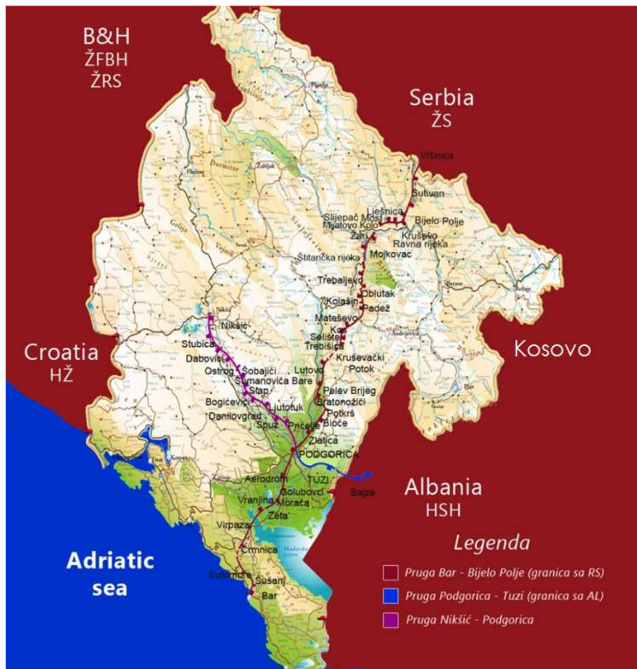
Prilog 2. Pregled mreže željezničkih pruga u Crnoj Gori